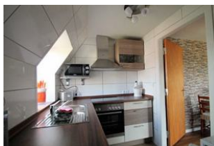
Ein weiterer Blick in die Küche