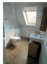
Ein weiterer Blick ins Bad