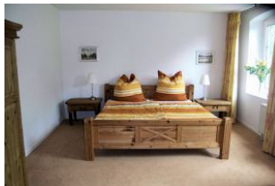
Blick in eines der zwei Schlafräume