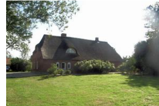
Rückseite des Hauses mit großen Garten.