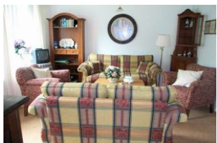
Geschmackvoll eingerichtetes Wohnzimmer