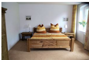
Blick in eines der zwei Schlafräume