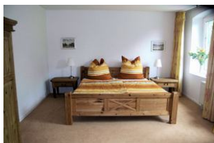
Blick in eines der zwei Schlafräume