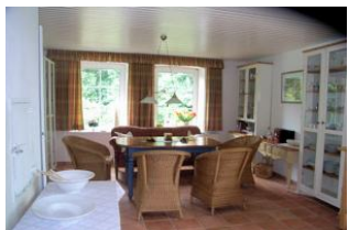
Große Wohnküche mit gemütlicher Sitzecke und Zugang zum Garten

Nahe Dagebüll, im Kleiseer-Koog, liegt dieses wunderschöne reetgedeckte Friesenhaus. Es wurde 1875 erbaut, 1979 umgebaut und im Jahr 2000 komplett neu renoviert. Das Haus mit 2 Ferienwohnungen und einem großen Garten ist ein idealer Ausgangspunkt, auch für zwei befreundete Familien, um Nordfriesland mit den Inseln und Halligen vor der Küste kennenzulernen. In der größeren Wohnung können 4-6 Personen einen herrlichen Urlaub verbringen.