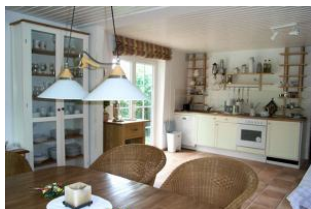
Die Küche aus einer anderen Perspektive