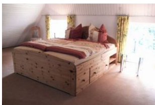
Das zweite große Schlafzimmer befindet sich im 1. Stock