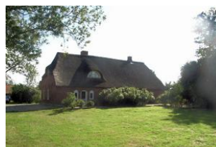
Rückseite des Hauses mit großen Garten.