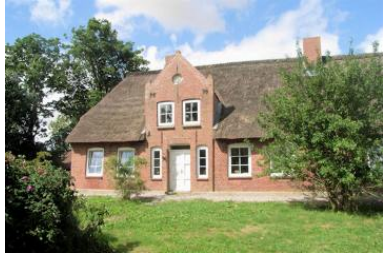
Wunderschönes Friesenhaus mit 2 Ferienwohnungen

Die Unterkunft verteilt sich über EG und 1.OG.