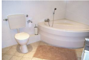
Badezimmer mit Eckwanne