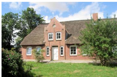
Wunderschönes Friesenhaus mit 2 Ferienwohnungen

Die Unterkunft verteilt sich über EG und 1.OG.