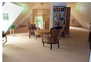
Das zweite Schlafzimmer mit kleiner Sitzgruppe und Schreibtisch