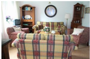
Geschmackvoll eingerichtetes Wohnzimmer