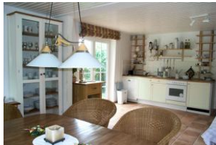
Die Küche aus einer anderen Perspektive