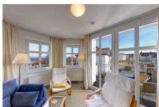
Wohnbereich mit Seeblick

Direkt an der Strandpromenade mit SEEBLICK und FAHRSTUHL im Haus! Schönes geräumiges 2-Zimmer-Apartment mit hochwertiger Ausstattung. Separates Schlafzimmer, Wohnzimmer mit Küchenzeile und Essplatz, Duschbad, Balkon nach Osten - zum Frühstück in der Sonne. Die Wohnung verfügt über einen Tiefgaragen-Pkw-Stellplatz. In der Garage können auch Fahrräder und ähnliches untergestellt werden. Von der "Villa Aquamarina" aus können Sie das Ortszentrum und die Ahlbecker Seebrücke in ca. 3 Minuten zu Fuß erreichen. Zum Strand sind es 50 m.