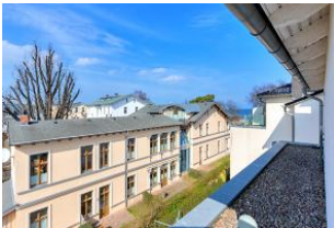
Dachterrasse (Blick seitlich)