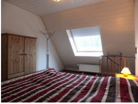
Das weitere Doppelschlafzimmer befindet sich im Dachgeschoss und ist durch eine Wendeltreppe zu erreichen.

Ihr Gartenplatz mit eigenem Strandkorb zum Entspannen! Gegenüber des Hauseingangs liegt der eigene Gartenplatz.