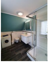
Badezimmer mit Dusche und Waschmaschine im 1. OG