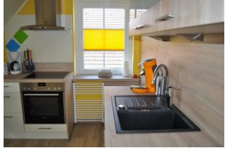
... und lässt keine Wünsche offen.