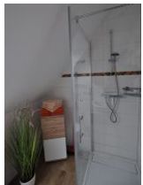
... mit großzügiger Dusche ...