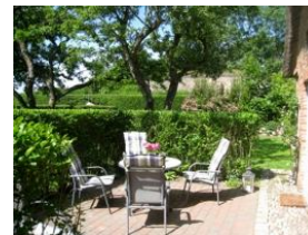
...hier läßt es sich aushalten....