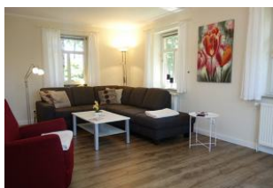
Die Wohnlandschaft - herrlich zum relaxen...