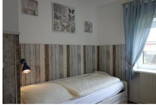
Ein Einzelzimmer mit ...