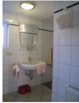
Das renovierte Bad mit ...