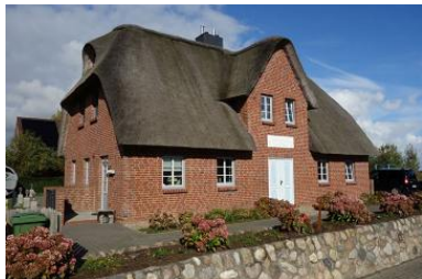
Das Doppelhaus "Golfoase"

Die Unterkunft verteilt sich über EG, 1.OG und DG.