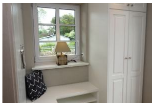
Treten Sie ein, ein kleiner Flur mit Sitzbank erwartet Sie...