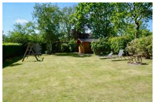
Garten mit Schaukel

Sind Sie reif für die Insel? Haben Sie lust die Seele einmal richtig baumeln zu lassen? Dann sind Sie in diesem Haus genau richtig!