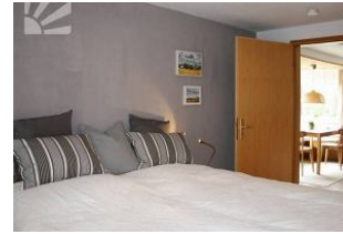
Schlafzimmer mit Einbauschränk