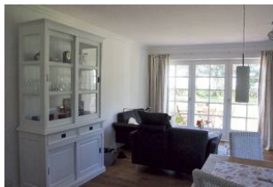
gemütlich genießen mit Weitblick