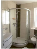
Badezimmer im 1 OG