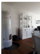
Wohnbereich mit Kaminofen