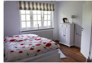
Schlafzimmer im 1 OG