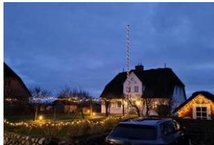
Die Aussenansicht in der Winterzeit

Das Reetdachhausteil liegt in exponierter ruhig Lage, in einer Sackgasse, mit einem grossen Garten können Sie hier relaxen und entspannen und sie haben einen unverbauten Blick in einer aussergewöhnliche Lage mit Deichblick. Das gemütliche Haus besteht aus einem Wohnzimmer mit Kamin und direktem Zugang zum Garten mit Strandkorb, die Küche ist sehr gut ausgestattete mit Mikrowelle, Geschirrspüler und allem was man benötigt, im Erdgeschoss gehen sie auf warme Terracottafliesen Ein Badezimmer mit Dusche befindet sich im Erdgeschoss und das zweite Badezimmer mit Badewanne und Doppelwaschtisch im 1 OG. Im 1 OG haben Sie zwei Schlafzimmer mit einem 1,60 Bett und einem Kajüten Bett was man ausziehen kann für 2 Pers. Im 2. OG haben Sie einen kleinen Ruheraum mit Fernseher.