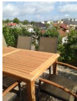
Terrasse mit Garten