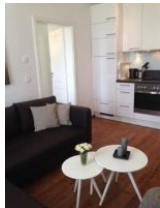
Wohnraum mit offener Küche