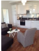
Wohnraum mit offener Küche