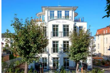
Hausansicht aus der Architektenplanung