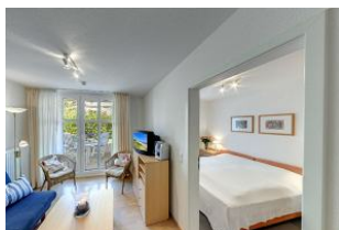
Blick in das Schlafzimmer