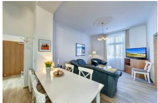
Wohnraum mit direktem Zugang zum Garten und dortiger Terrasse

Direkt an der Strandpromenade mit großem GARTEN und SÜDBALKON! Schönes komfortables 4 - Zimmer - Apartment mit guter und vollwertiger Ausstattung. Drei separate Schlafzimmer, separate Küche, zus. Essplatz im Wohnraum, Duschbad und Gäste-WC, Wohnraum mit direktem Gartenzugang und Terrasse, Südbalkon mit Sonne bis abends. Die Wohnung verfügt über einen Pkw-Stellplatz. In der Garage können Fahrräder und ähnliches untergestellt werden. Im Haus gibt es eine Sauna. Von der "Villa Germania" aus können Sie das Ortszentrum und die bekannte Ahlbecker Seebrücke in ca. 3 Minuten zu Fuß erreichen. Zum Strand sind es 50 m. Von Mai bis September ist ein Strandkorb im Tagespreis enthalten!