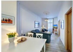
Wohnraum mit direktem Zugang zum Garten und dortiger Terrasse