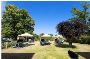
Garten mit Terrassen und Strandkörben (Mai bis September)