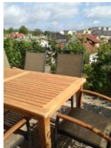
Terrasse mit Garten