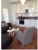
Wohnraum mit offener Küche