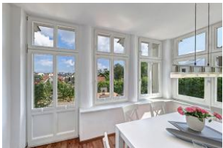
Essplatz in verglaster Veranda

Schicke 4-Zimmer-Wohnung mit Veranda und Terrasse - mit schönem weitem Blick! Die Wohnung ist elegant im Altbau-Stil eingerichtet und komfortabel ausgestattet. Sie wurde 2016 komplett renoviert mit Fußbodenheizung. Die Wohnung verfügt über drei separate Schlafzimmer, jeweils mit zugehörigem ensuite-Bad, Wohnzimmer mit Küchenzeile und Essplatz in der Veranda. Von den drei Bädern sind zwei Duschbäder und eines ein Whirlpool. Die Wohnung verfügt weiter über einen Eingangsflur mit Garderobe. Aus der Veranda gelangt man auf die möblierte Terrasse und in den Garten. Ein Pkw-Stellplatz ist inklusive, ein zweiter Parkplatz kann hinzugemietet werden. Die Villa Margarete steht etwas erhöht in der Bergstrasse, wodurch sich ein schöner Blick ergibt. Die Wohnung befindet sich im EG, etwa 300m zur Strandpromenade. Zum Ortszentrum und der bekannten Ahlbecker Seebücke sind es ca. 8-10 Minuten zu Fuß.