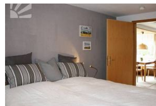
Schlafzimmer mit Einbauschränk