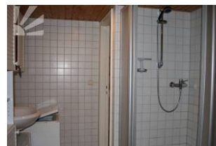
grosses Bsd mit Dusche, WC, Waschmaschine