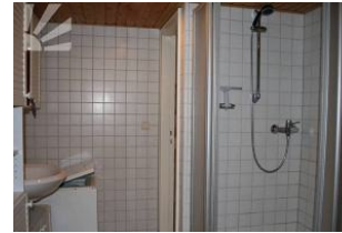
grosses Bsd mit Dusche, WC, Waschmaschine