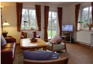
Das TV Gerät, Austritt auf die Terrasse