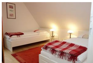
Zwei Einzelbetten im Kinderzimmer