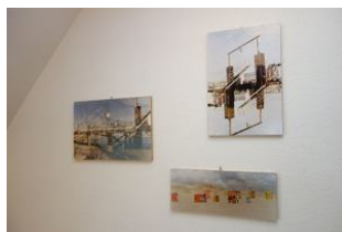
Bilder im Flur im OG