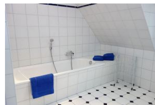
...und Badewanne !