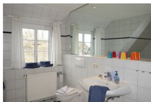
...mit großem Fenster ...