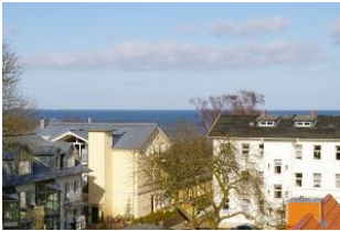
Seeblick vom Balkon