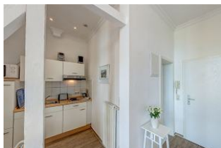
Küche / Eßplatz / links großer Balkon