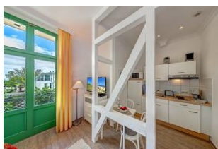
Wohnen / Schlafen