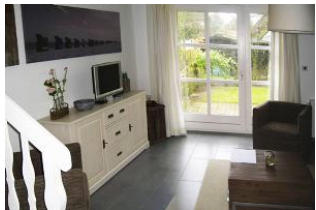
Ausgang zum gemütlichen Gartenteil

Verbringen Sie Ihren Urlaub in einem Haus in dem es Ihnen an nichts fehlen wird. Unser Hausteil bietet Ihnen ca. 60qm Wohnfläche auf 2 Etagen, einen separaten Eingang sowie einen eigenen Garten. Nieblum ist das schönste Dorf der Insel. Den historischen Ortskern erreichen Sie in 3 Minuten und zum Strand gehen Sie gemütlich ca. 10 Min. Im Sommer wie auch im Winter können Sie sich in unserem Haus wohlfühlen. Die Fußbodenheizung und der offene Kamin sorgen für eine gemütliche Atmosphäre.