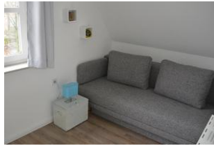
zweites Schlafzimmer mit Ausziehcouch und Schrankbett