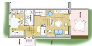
Grundriss Erdgeschoss - Küche, Bad, Wohnzimmer