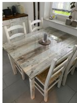
Küche im EG mit Trockner und Geschirrspülmaschine,