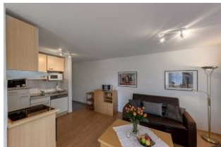
Küche und Wohnbereich