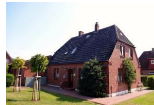
Der Anbau befindet sich links vom Haus. Sie haben einen direkten Ausgang in den wunderschönen Garten.