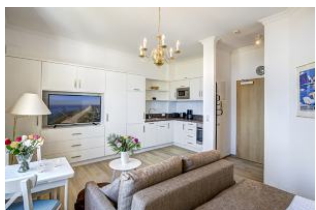
Wohnen, Essen, Küche