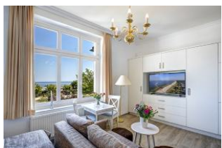
Wohnen, Essen, Seeblick

Direkt an der Strandpromenade mit direktem SEEBLICK! Schönes geräumiges 1 - Zimmer - Apartment im I. OG mit hübscher Möblierung und guter Ausstattung, Küchenzeile, Duschbad und Blick zur See. Die Wohnung verfügt über einen Pkw-Stellplatz. In der Garage können Fahrräder und ähnliches untergestellt werden. Im Haus gibt es eine Sauna. Von der "Villa Germania" aus können Sie das Ortszentrum und die bekannte Ahlbecker Seebrücke in ca. 3 Minuten zu Fuß erreichen. Zum Strand sind es 50 m. Von Mai bis September ist ein Strandkorb im Tagespreis enthalten. Von Mai bis September ist ein Strandkorb im Tagespreis enthalten.