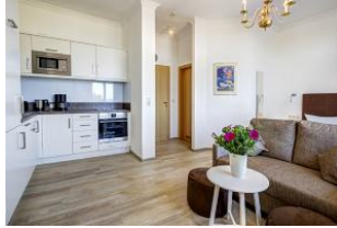
Blick zum Flur und zur Badtür