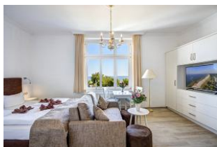
Schlafen, Wohnen, Essen