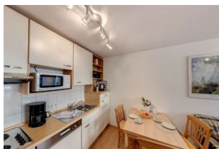
Küche mit Essbereich