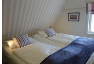
Das "lila" Schlafzimmer mit Doppelbett (200x200cm)