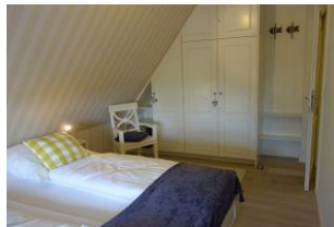
... mit Einbauschränk.