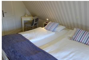
...und kleinem Schreibsekretär.