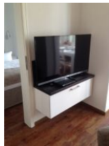
großer Flachbild TV