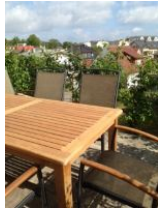
Terrasse mit Garten