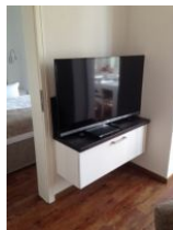
großer Flachbild TV