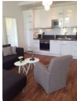
Wohnraum mit offener Küche