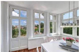
Essplatz in verglaster Veranda

Schicke 4-Zimmer-Wohnung mit Veranda und Terrasse - mit schönem weitem Blick! Die Wohnung ist elegant im Altbau-Stil eingerichtet und komfortabel ausgestattet. Sie wurde 2016 komplett renoviert mit Fußbodenheizung. Die Wohnung verfügt über drei separate Schlafzimmer, jeweils mit zugehörigem ensuite-Bad, Wohnzimmer mit Küchenzeile und Essplatz in der Veranda. Von den drei Bädern sind zwei Duschbäder und eines ein Wannenbad. Die Wohnung verfügt weiter über einen Eingangsflur mit Garderobe. Aus der Veranda gelangt man auf die möblierte Terrasse und in den Garten. Ein Pkw-Stellplatz ist inklusive, ein zweiter Parkplatz kann hinzugemietet werden. Die Villa Margarete steht etwas erhöht in der Bergstrasse, wodurch sich ein schöner Blick ergibt. Die Wohnung befindet sich im EG, etwa 300m zur Strandpromenade. Zum Ortszentrum und der bekannten Ahlbecker Seebücke sind es ca. 8-10 Minuten zu Fuß.