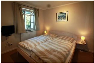
Das erste Schlafzimmer befindet sich im Erdgeschoss.