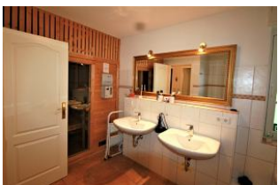
... und bietet eine kleine Sauna.