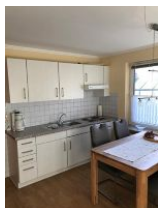
Küche und Wohnbereich