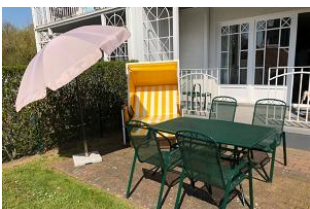
Der Garten ist eingezäunt.