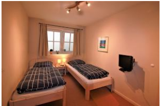
Das dritte Schlafzimmer befindet sich im UG und ist mit zwei Einzelbetten ausgestattet.