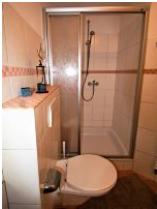
Das helle Duschbad...