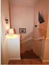
Der Treppenabgang in das Untergeschoss.