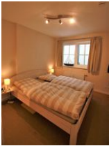
Das zweite Schlafzimmer mit gemütlichem Doppelbett im UG.