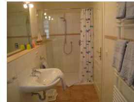
... einer herrlich großen Duschkabine.