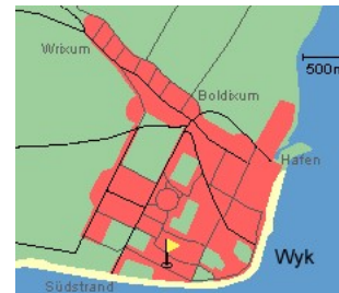
Entfernungen, zirka: zum Bäcker 20 m, zur Einkaufsmöglichkeit 200 m, zum Flugplatz 1,2 km, zum Golfplatz 1,4 km, zum Hafen 1,5 km, zum Meer 80 m, zum ÖPNV 300 m, zum Badstrand 80 m, zum Ortszentrum 1,2 km