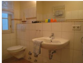
Im Badezimmer Handwaschbecken und WC, sowie...