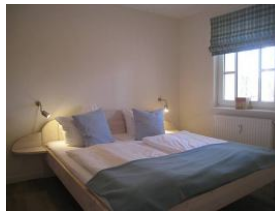
Das Elternschlafzimmer mit großem Doppelbett 180x200cm