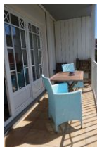
Der Balkon mit Tisch + 2 gemütlichen Sesseln. Zudem steht ein Hochlehner (Rückenlehne verstellbar) und Holzstühle zur Verfügung.