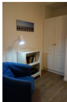
...kleiner Rückzugsort - der Lesesessel im Kinderzimmer