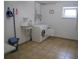
Waschmaschine und Trockner gegen Gebühr im Keller des Hauses