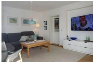
....hier noch einmal das Wohnzimmer