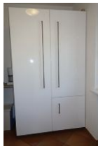
... der große Schrank beherbergt noch Geschirr und hat viel Platz für Lebensmittelreserven.