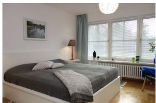
Großes Doppelbett 180x200cm ohne Fussteil...