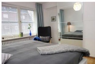
...Spiegel-Kleiderschrank für Kofferinhalte.