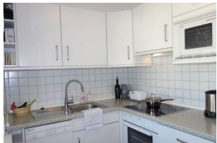
Die sep. Küche mit allem was man so braucht...