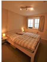
Das zweite Schlafzimmer mit gemütlichem Doppelbett im UG.