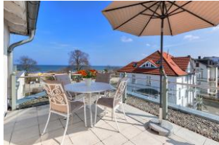
Dachterrasse mit tollem Meerblick