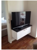
großer Flachbild TV