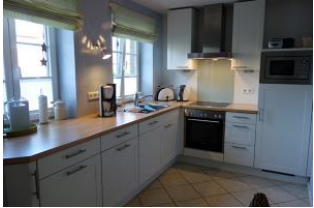
Die Küchenzeile hat "Alles was man so braucht"