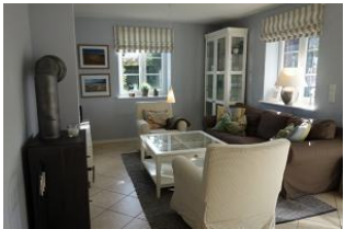
Blick ins Wohnzimmer mit gemütlicher Couchecke und Sessel.

Entfernungen, zirka: zum Bäcker 400 m, zur Einkaufsmöglichkeit 400 m, zum Flugplatz 2,5 km, zum Golfplatz 2,5 km, zum Hafen 5,0 km, zum Meer 1,0 km, zum ÖPNV 500 m, zum Badestrand 1,0 km, zum Ortszentrum 200 m