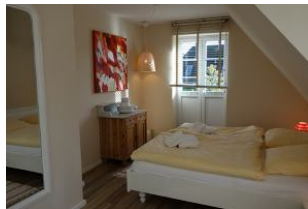
Das Doppelschlafzimmer im Obergeschoß