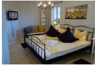
Großes Schlafzimmer im Erdgeschoß mit Doppelbett und zus. TV-Gerät