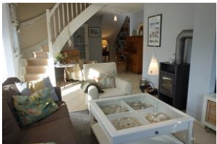
...hier von der anderen Seite zu sehen.