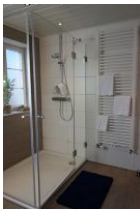
... geräumiger Dusche ....