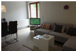
Das TV-Gerät steht auf einen Rollwagen.