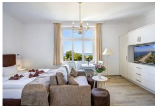
Schlafen, Wohnen, Essen