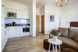
Blick zum Flur und zur Badtür