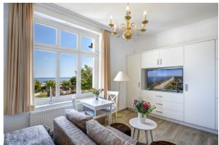
Wohnen, Essen, Seeblick

Direkt an der Strandpromenade mit direktem SEEBLICK! Schönes geräumiges 1 - Zimmer - Apartment im I. OG mit hübscher Möblierung und guter Ausstattung, Küchenzeile, Duschbad und Blick zur See. Die Wohnung verfügt über einen Pkw-Stellplatz. In der Garage können Fahrräder und ähnliches untergestellt werden. Im Haus gibt es eine Sauna. Von der "Villa Germania" aus können Sie das Ortszentrum und die bekannte Ahlbecker Seebrücke in ca. 3 Minuten zu Fuß erreichen. Zum Strand sind es 50 m. Von Mai bis September ist ein Strandkorb im Tagespreis enthalten. Von Mai bis September ist ein Strandkorb im Tagespreis enthalten.