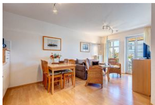
Essbereich und Sitzcke