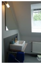
Im Dachgeschoß ein kleines Bad mit Handwaschbecken und ...