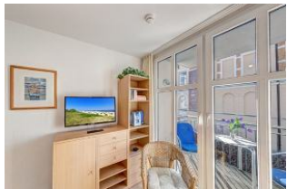
TV und Balkon

Direkt an der Strandpromenade mit SÜDBALKON und FAHRSTUHL im Haus! Schönes gemütliches 2-Zimmer-Apartment mit moderner guter Ausstattung. Separates Schlafzimmer (mit Fernseher), Wohnzimmer mit Küchenzeile und Essplatz, Duschbad, Balkon nach Süden mit Sonne bis abends. Die Wohnung verfügt über einen Tiefgaragen-Pkw-Stellplatz. In der Garage können auch Fahrräder und ähnliches untergestellt werden. In unserer "Villa Germania" nebenan gibt es eine Sauna. Von der "Villa Aquamarina" sind es zum Ortszentrum und der Seebücke ca. 3 Minuten zu Fuß. Zum Strand sind es 50 m.