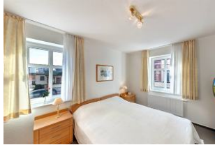
Schlafzimmer mit Fernseher