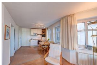
heller Wohnbereich mit Fernseher