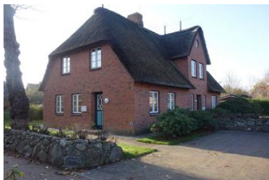
Das Ferienhaus OHI Dörp 49f in Wrixum im Herbst

Die Unterkunft verteilt sich über EG und EG.