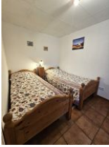
... mit zwei Einzelbetten.