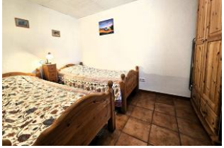
Das zweite Schlafzimmer ...