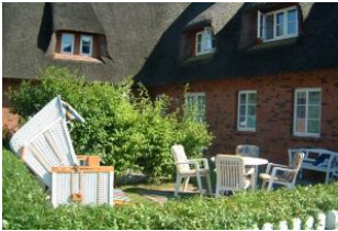
Der schöne Platz auf der eigenen Terrasse - mit Strandkorb.