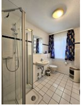
Das helle und moderne Duschbad.