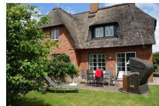
Die Terrasse mit Tisch und Stühlen, Liege, Strandkorb und.....viel Sonnenschein