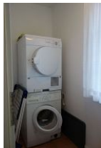
Im Hauswirtschaftsraum zur kostenfreien Nutzung; Waschmaschine und Trockner.