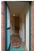
Treten Sie ein und fühlen sich einfach wohl....

...wer mag nicht gern beim aufwachen den Geruch von frisch gebackenen Brötchen riechen ??? Sie müssen die Backwaren noch selbst holen, aber es sind nur ein paar Schritte bis zum Bäcker Hansen Das Haus Kastanie bietet eine moderne Doppelhaushälfte für 4 Personen + Baby (im Notfall gibt es auch noch zwei weitere Schlafplätze) Eine voll eingerichtete Küche, Wohnzimmer mit großzügigem Essplatz, 2 Duschbädern und zwei Schlafzimmern ! Hier findet die ganze Familie Platz. Und Ihre Fellnase darf auch mit. Kommen Sie, schauen Sie...und fühlen Sie sich einfach wohl !