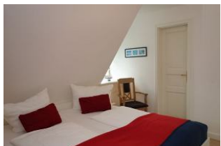
Das Elternschlafzimmer mit 2 Fenstern, eins mit Fliegengitter versehen. Die Tür führt ins Bad.