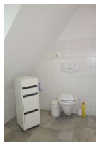
...und die Toilette