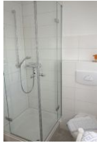
Die Dusche im Erdgeschoß