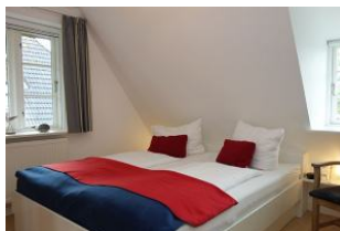
...und das zweite Fenster.