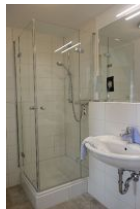
Das Duschbad im Obergeschoß, vom Elternschlafzimmer aus zu begehen.